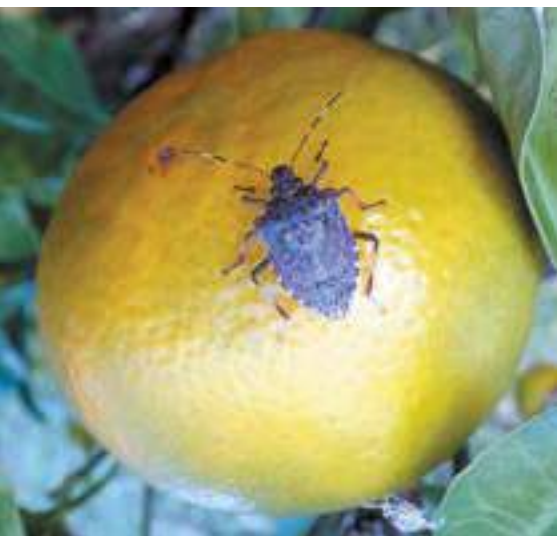
Рис. 2. Имаго коричнево-мраморного клопа

Яйца белые шаровидные, на нижней стороне листьев различных растений. Количество яиц в одной яйцекладке колеблется от 15 до 40 шт. (рис. 3). Личинки (нимфы) I возраста черноранжевые (рис. 4), II возраста – черные (рис. 5), затем светлеют (III-V возраста), отличаются неравномерной окраской и отсутствием крыльев. Сверху тела имеются оранжево-желтые пятна (Streito, 2015), по бокам груди – шипы (рис. 6-8).