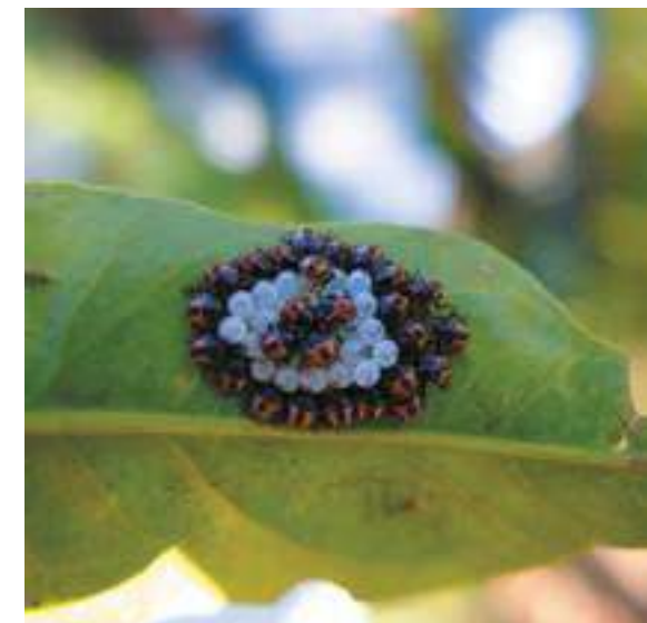
Рис. 4. Отрождающиеся личинки (нимфы) коричнево-мраморного клопа (I возраст)