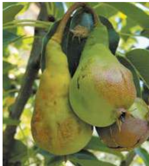
Рис. 9. Повреждение плодов груши коричнево-мраморным клопом

Коричнево-мраморный клоп в местах массового размножения также имеет статус «досягающего вредителя»: забираясь в жилища человека, он вызывает беспокойство; кроме того, клопы неприятно пахнут и могут вызывать аллергию у особенно чувствительных людей.