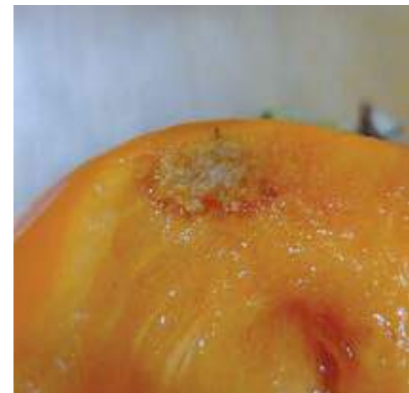
Рис. 12. Повреждение плодов хурмы коричнево-мраморным клопом