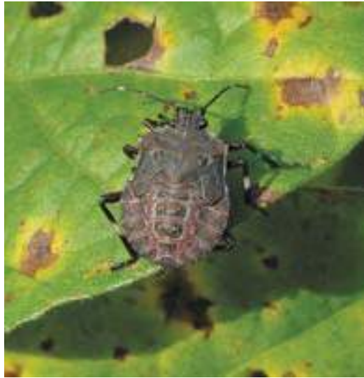
Рис. 8. Нимфа коричнево-мраморного клопа V возраста

Коричнево-мраморный клоп – теплолюбивое насекомое, развивается в пределах температур от +15 до +33 °С. При +15 °С могут развиваться только эмбрионы, тогда как отродившиеся личинки при этой температуре погибают, а температура +35 °С критична для всех стадий развития. При +33 °С выживает лишь 5% особей (Nielsen, 2008). Оптимальная температура воздуха, требуемая для нормального развития поколения вредителя – +18-25 °С. В зависимости от теплообеспеченности региона обита-