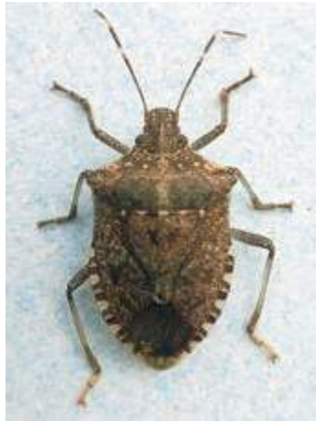
Рис. 22. Коричнево-мраморный клоп

к парковым древостоям и плодовым садам и также очень часто зимующим в различных помещениях. Но у этого вида верх тела имеет металлический отблеск, а перепоночка надкрылий – темный точечный орнамент, а не продольные пятна, как у коричнево-мраморного клопа (рис. 22).