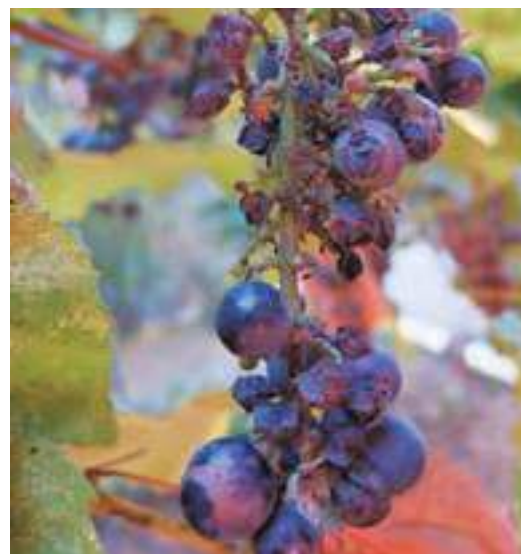
Рис. 11. Повреждение плодов винограда коричнево-мраморным клопом