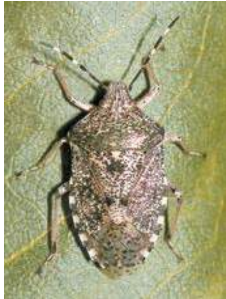
Рис. 21. Клоп Rharphigaster nebulosa