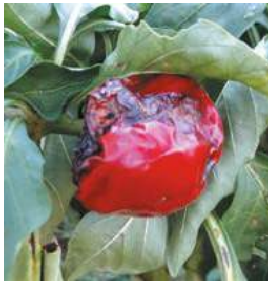
Рис. 15. Повреждение плодов сладкого перца коричнево-мраморным клопом