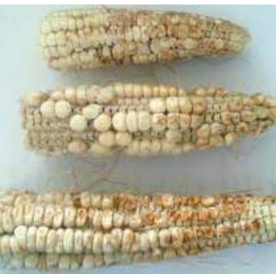
Рис. 14. Повреждение початков кукурузы коричнево-мраморным клопом