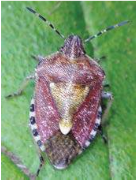
Рис. 19. Клоп Dolycoris baccarum