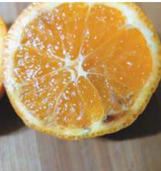
Рис. 13. Повреждение плодов мандарина (видны деформированная ткань и некроз, развивающийся в местах проколов) коричнево-мраморным клопом