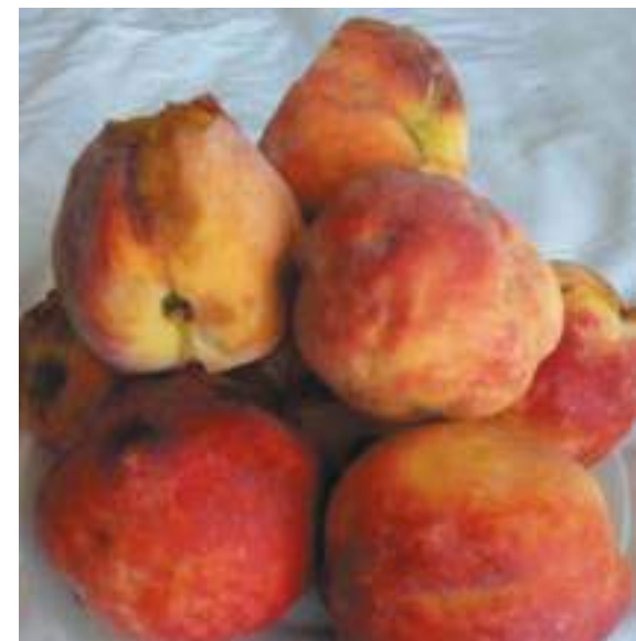
Рис. 10. Повреждение плодов персика коричнево-мраморным клопом