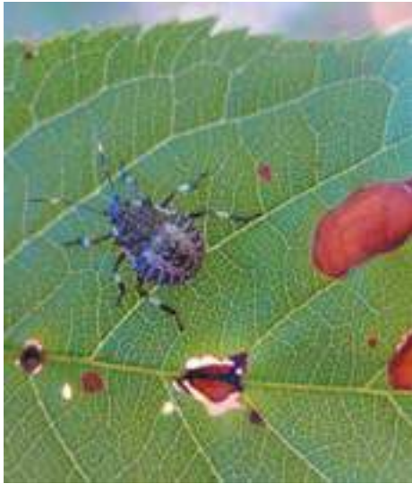
Рис. 7. Нимфа коричнево-мраморного клопа IV возраста