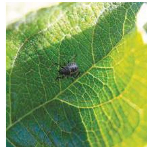
Рис. 6. Нимфа коричнево-мраморного клопа III возраста