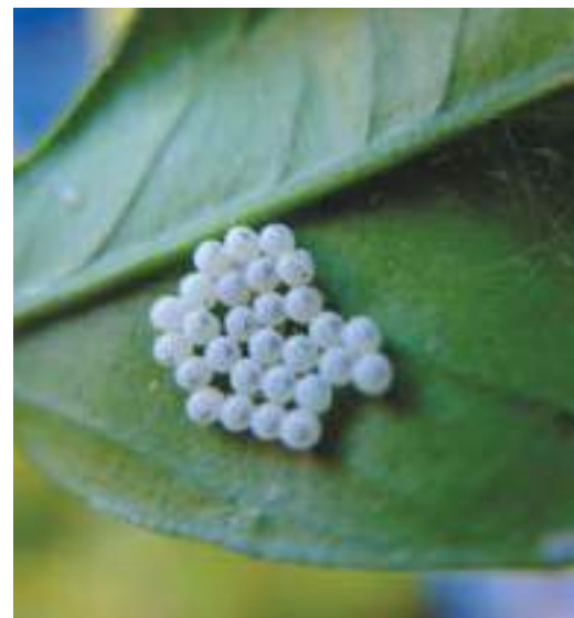
Рис. 3. Яйцекладка коричнево-мраморного клопа