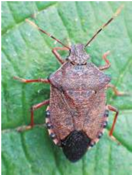
Рис. 20. Клоп Arma custos