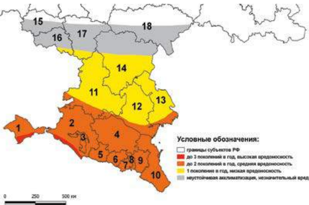
Рис. 1. Карта-схема потенциального ареала и зон вредоносности коричнево-мраморного клопа в Российской Федерации.