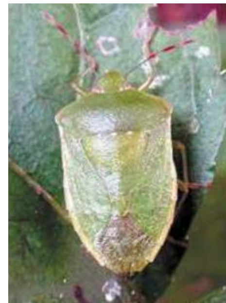
Рис. 18. Клоп Nezara viridula