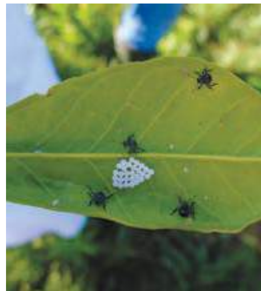
Рис. 5. Личинки (нимфы) коричнево-мраморного клопа II возраста