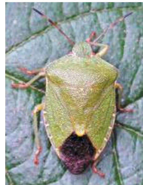
Рис. 17. Клоп Palomena prasina

Несколько труднее может быть различение коричнево-мраморного клопа с широко распространенным полифагом – клопом Rhaphigaster nebulosa Poda (рис. 21, 23), тяготеющим